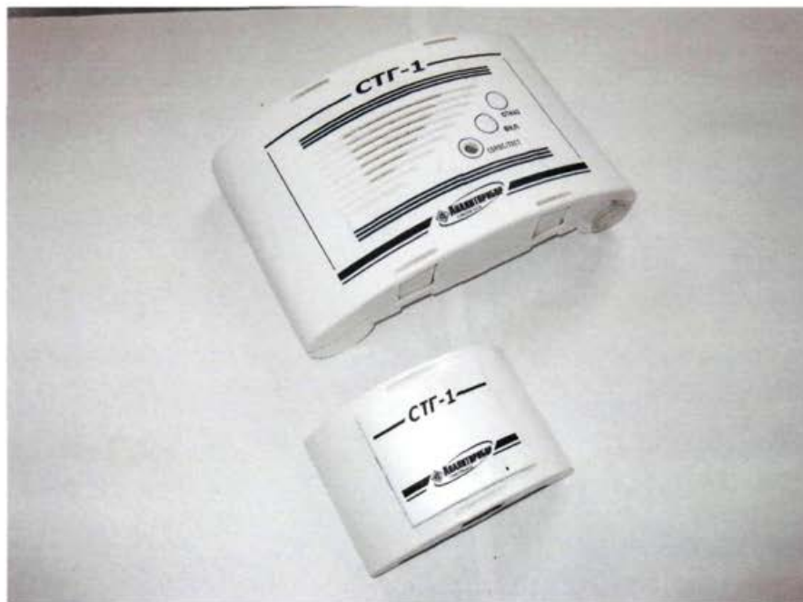
Рисунок 1– Внешний вид сигнализаторов

Внешний вид сигнализаторов показан на рисунке 1.