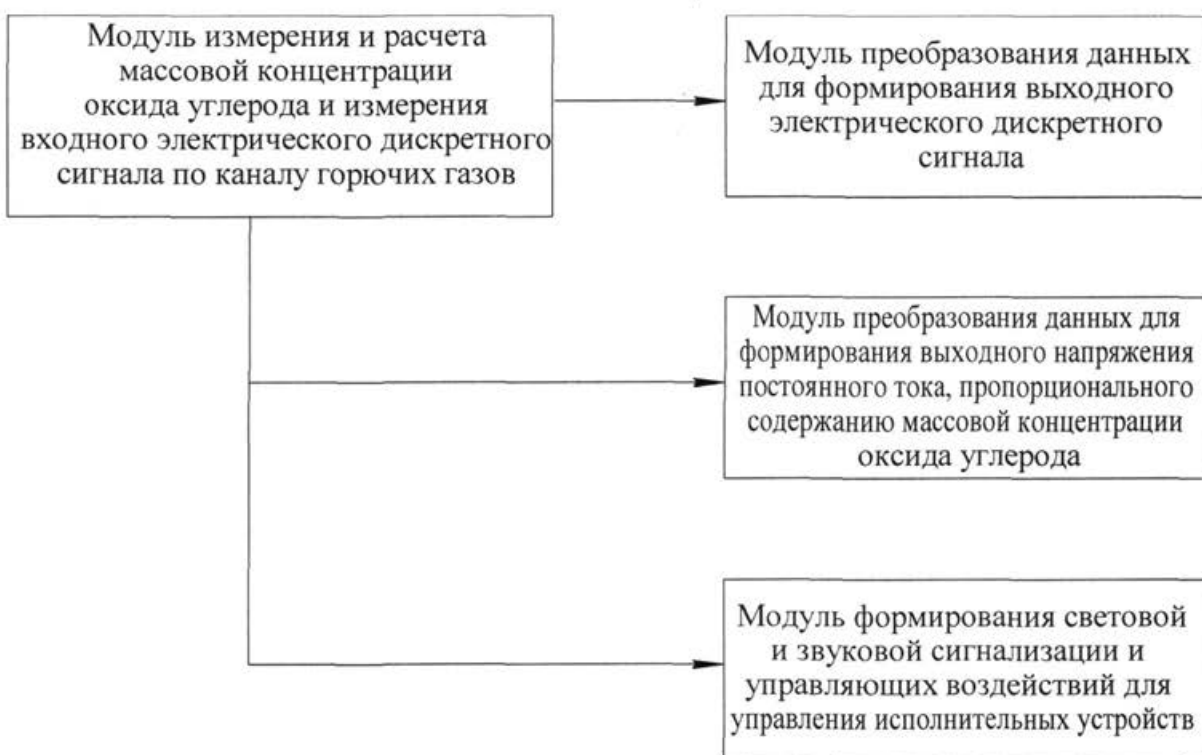
Рисунок 3 - Структура ПО.