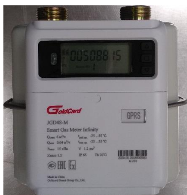
а) типоразмер G4

Пломбировку поставщика газа осуществляют с помощью проволоки и свинцовой (пластмассовой) пломбы или на специальную мастику в чашке винта крепления.