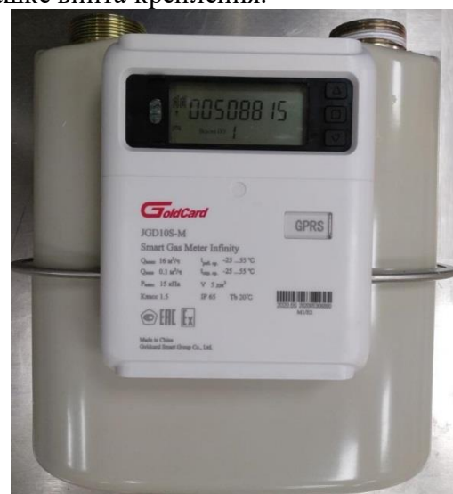
в) типоразмер G10