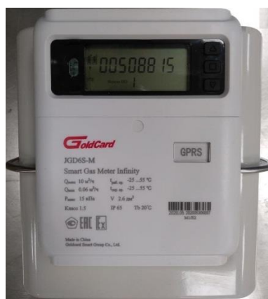
б) типоразмер G6