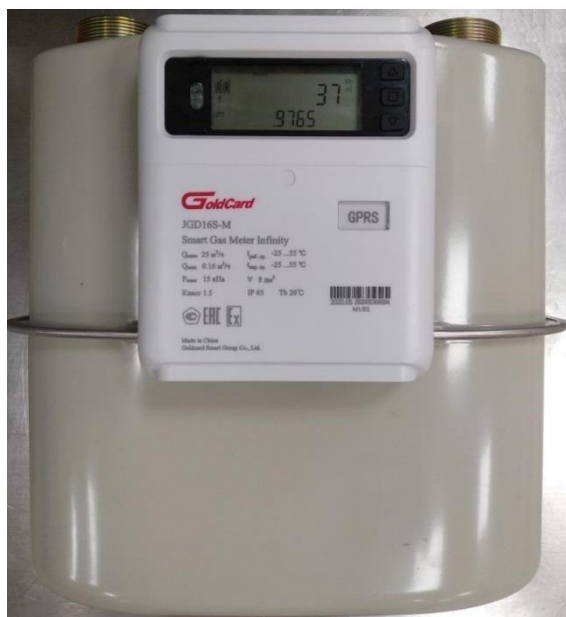
г) типоразмер G16