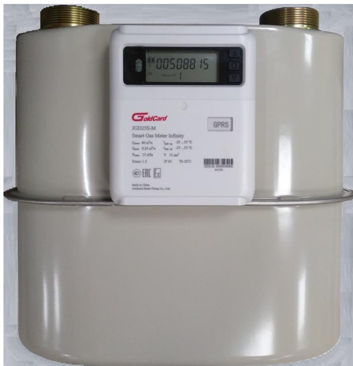
д) типоразмер G25