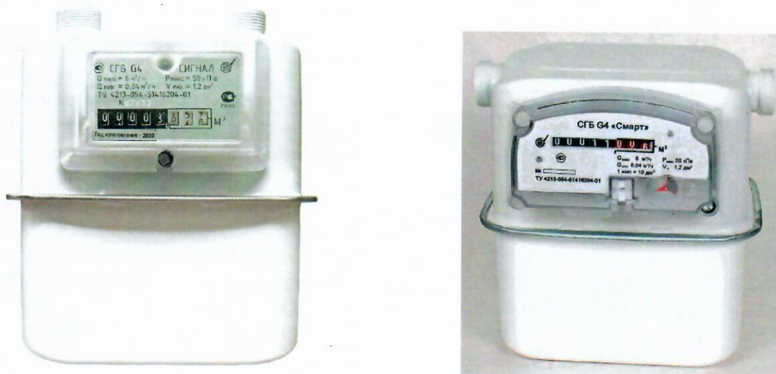
Рисунок 1 - Общий вид счетчика газа бытового СГБ G4 СИГНАЛ (левый, вертикальный, М33х1,5) и СГБ «Смарт» G4-1 (левый, горизонтальный, М33х1,5)

На рисунке 2 приведена схема пломбировки и обозначение мест для нанесения оттиска поверительного клейма и пломб завода-изготовителя для защиты от несанкционированного доступа.